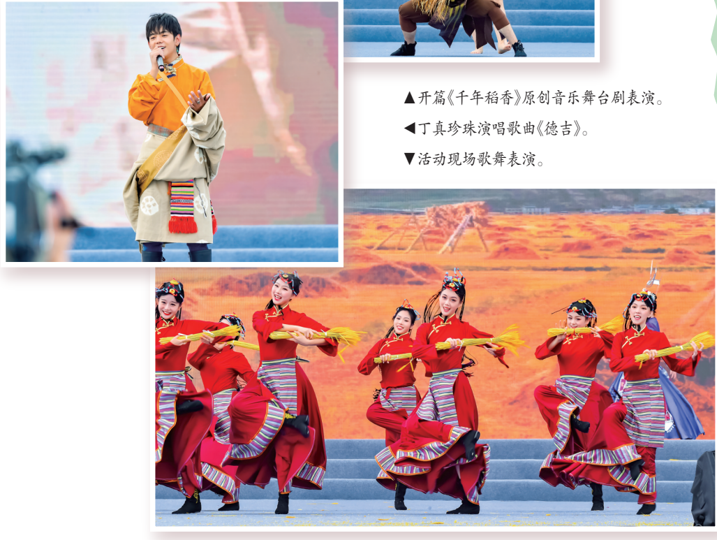
▲开篇《千年稻香》原创音乐舞台剧表演。 ▲丁真珍珠演唱歌曲《德吉》。 ▼活动现场歌舞表演。

孕育三星堆的鸭子河,奔流不息绵绵不绝。回眸岁月深处,古蜀先民在这里繁衍生息。千年之后,丰收的喜悦又在鸭子河回响。9月23日上午,2021年中国农民丰收节(四川)庆丰收群众联欢活动,在德阳广汉市三星堆遗址三星石口袋台公演。作为中国农民丰收节主场活动之一,四川这场精心筹备的群众联欢活动,不仅带来了极具乡土特色的民俗歌舞表演,而且充分融入长江流域和三星堆等主题元素,上演了一场“穿越”大戏,让人们体会到不同的丰收滋味。