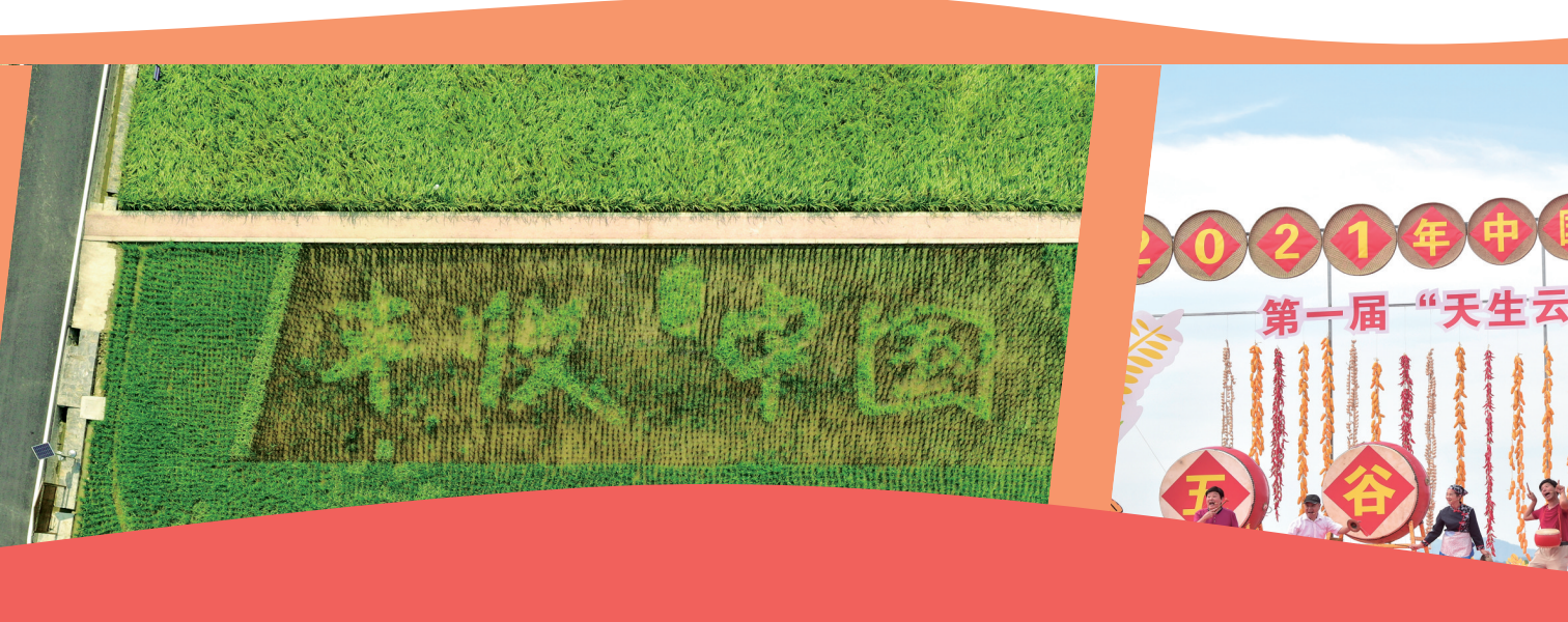
湖南·长沙 农民日报·中国农民网记者 杨娟 吴烁星 摄

平台展示自己。”石山乡乡长王文飞介绍,华尖村以前没有产业,2018年产业扶贫开始后,从东北引进了200多头梅花鹿,经过几年的发展,现在养殖规模逐渐扩大,鹿产品也逐渐上市,预计今年收入能实现60万元,这笔资金一部分用来可持续发展,一部分用来产业分红。 “今年的丰收节我们首次以乡镇为单位,有11大类,120多个品种参展,通过农民丰收节这个平台宣传各乡特色农产品。”大通县农业农村局综合办副主任刘得元介绍,近年来,全县的农业产业得到了长足的发展,从传统农业到现代农业,如今已经实现了从生产、加工到销售一条龙产业链,通过一、二、三产业发展,全县的农业产值逐年增长,通过亮相丰收节,挖掘潜力,展示产业。