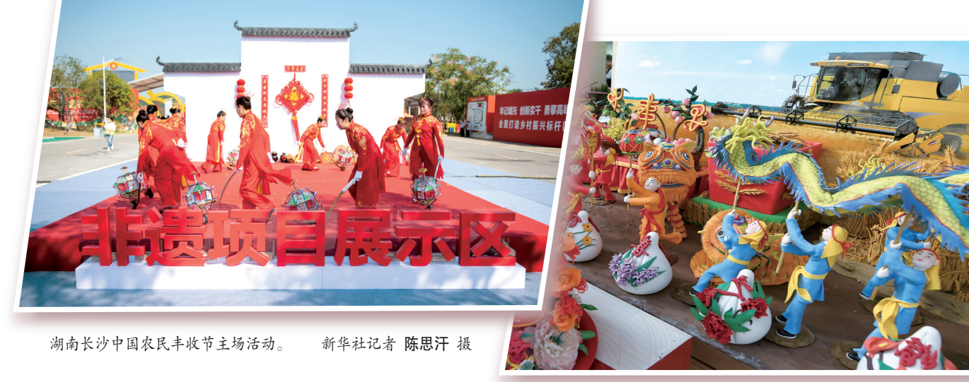
湖南长沙中国农民丰收节主场活动。

看完花车,逛完集市,再將目光移向湘家荡月亮湾沙滩,这里正在举行长江水文化习俗展演活动。为了充分展示全面建成小康社会的历史性成就,此次嘉兴主场活动精心策划了我的家乡“奔共富”之路“丰收盛世”三大篇章,歌舞表演、非遗技艺表演、水上特技表演等10个特色融合节目轮番登场。